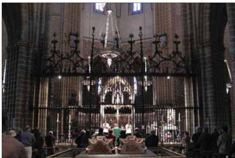
La Virgen de Ujué permaneció en la Catedral de Pamplona durante el tiempo de la restauración (a la derecha).

que se accede al interior de la iglesia, en donde se dan a conocer datos sobre el tipo de construcción, la talla de la Virgen o las pinturas murales encontradas en el coro durante los trabajos de restauración. La visita continuaba en el Paseo de Ronda, la portada norte y la torre románica desde la que se puede contemplar una panorámica de la villa. En su ascenso, un ventanal permite observar los ábsides románicos.