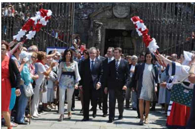
Los presidentes Sanz y Nuñez Feijó en el Día de Navarra en Santiago.