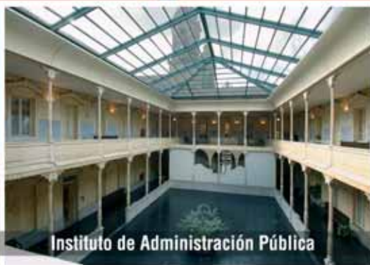
Instituto de Administración Pública