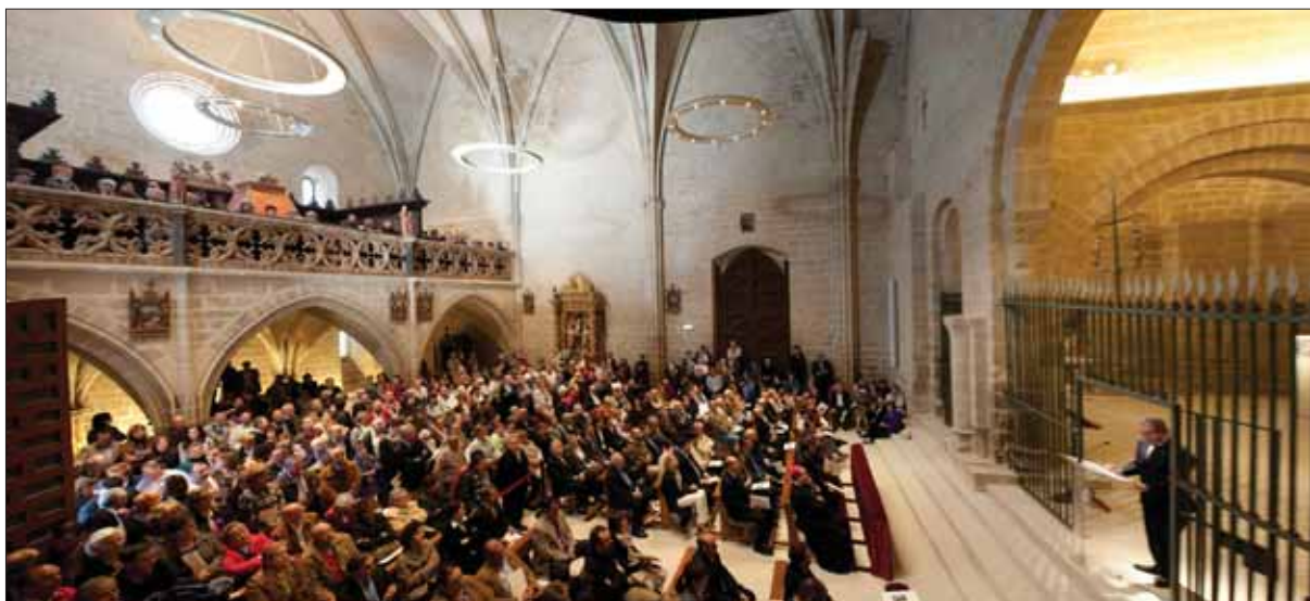
Acto de presentación de la rehabilitación de Santa María de Ujué.

tino de visitantes interesados en la historia y en el arte”.