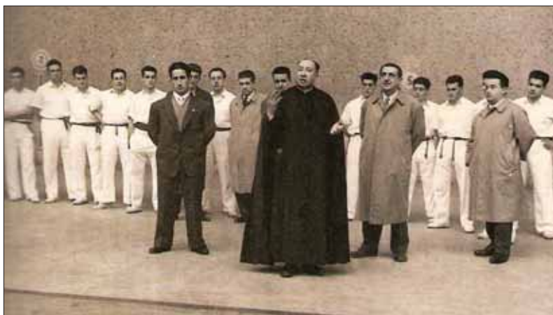
Homenaje a J. Ezcurrea, Campeón del mundo de pelota.

En definitiva, el deporte puede mostrarnos la evolución social a la vez que nos indica de forma amena los gustos, preferencias y pasiones de los navarros. Aunque es un tema al que todavía le queda mucho para verse completado, en este libro hemos pretendido abordar una faceta de enorme relevancia en nuestro tiempo, y esperamos que la iniciativa ponga en marcha nuevas investigaciones y la conservación del legado histórico relacionado con el deporte.