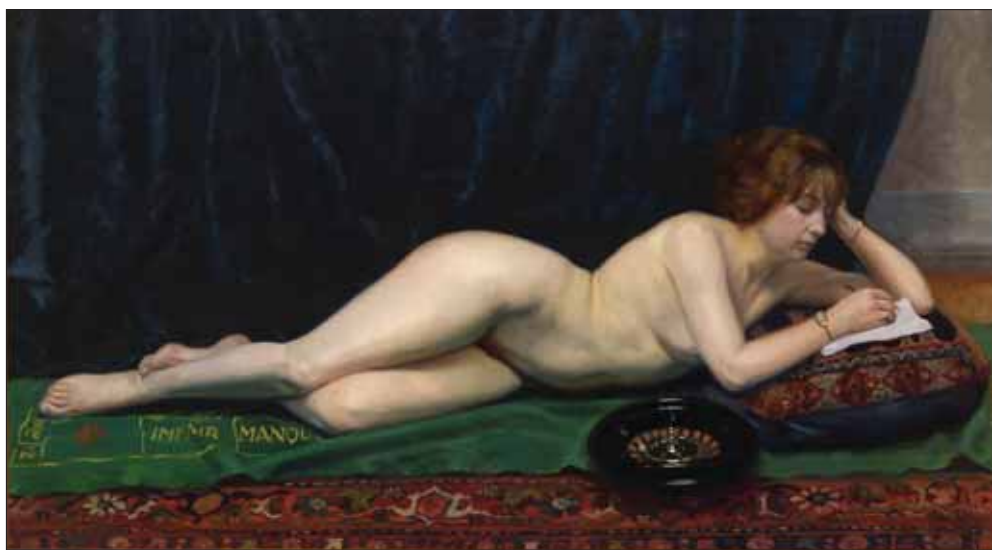
Combinación de la ruleta (1912-1914).