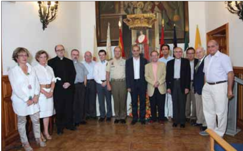
Reunión del 13 de agosto.

boración de un texto que recogiese conjuntamente las leyes creadas específicamente para las Indias. Palafox, como miembro del Consejo de Indias, se vio inmerso en esta tarea, en la que participó activamente, como miembro de la Junta que revisó el proyecto de Recopilación de Leyes de Indias, elaborado por Antonio de León Pinelo.