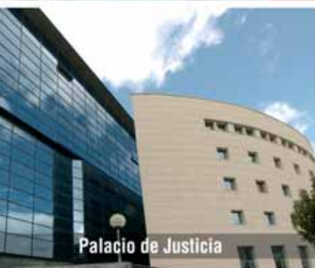
Palacio de Justicia

XXV ANIVERSARI AMEJORAMIENT DEL FUER 1982-2007