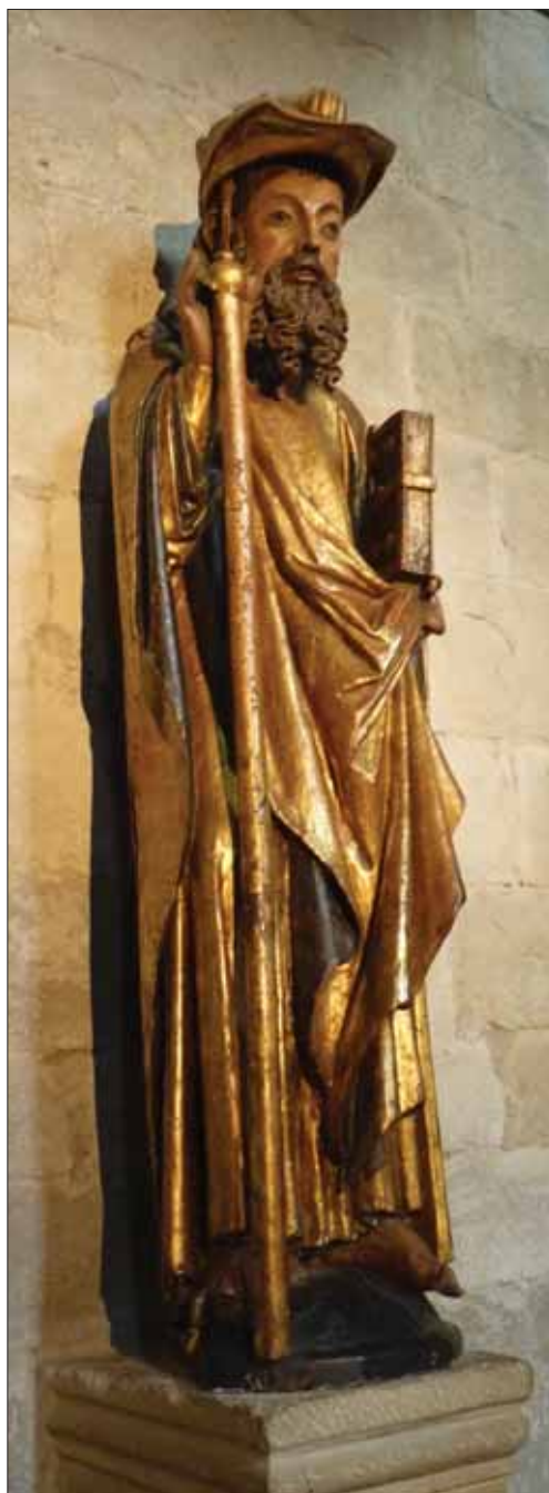
Santiago peregrino, en la parroquia de Santiago de Puente la Reina.

Definida una iconografía convencional de peregrino desde finales del siglo XI, ésta no se aplicará pronto al Apóstol, dado que durante un largo periodo de tiempo la imagen del santo sólo portará algún detalle distintivo de la peregrinación y su verdadero