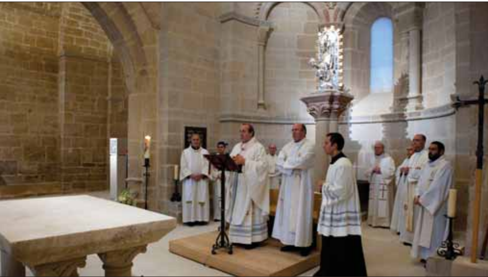
EL arzobispo de Pamplona y obispo de Tudela, Francisco Pérez, en el acto de inauguración.

E l Presidente del Gobierno de Navarra, Miguel Sanz Sesma inauguró, el pasado 24 de abril, los trabajos de restauración del interior de la iglesia-fortaleza de Santa María de Ujué, unas obras que se han desarrollado durante el último año y que ponen punto final a las intervenciones en este edificio, emprendidas en 2002 y que han exigido un desembolso total de 3,5 millones de euros.