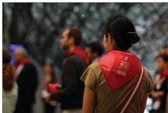
Pañuelos rojos en los dos idiomas.

De los 15.640 espectadores que asistieron a alguna de las actividades, 10.360 acudieron a las actuaciones musicales ofrecidas por los Hermanos Aznárez en la Plaza del Pabellón de España y 5.280, a las proyecciones de los audiovisuales “El encierro” (en 3D) y “Navarra,