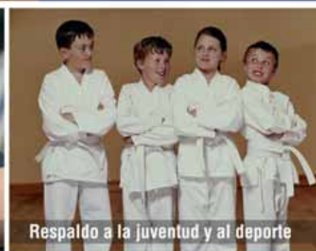
Respaldo a la juventud y al deporte