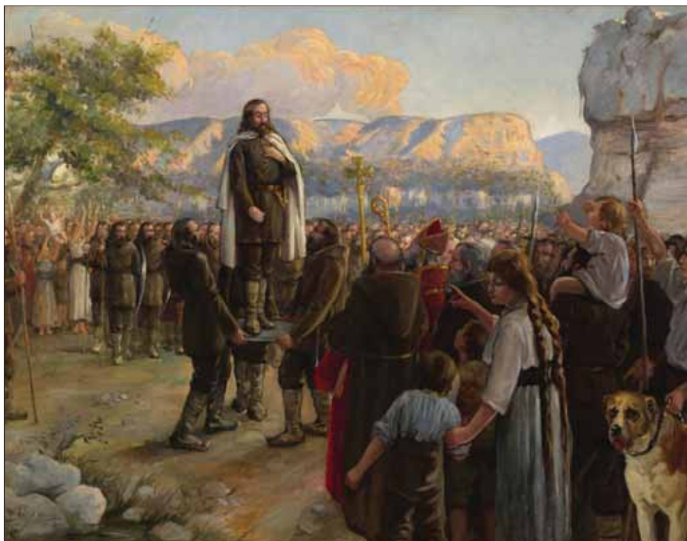
Proclamación del primer rey de Navarra (1914).

¿Qué huella dejó el paso por París en la pintura de Ciga? Esta se puede medir a varios niveles. En cuanto al perfeccionamiento de la técnica, se centró en el dibujo, el entendimiento del color y la afinación del buen gusto), puesto que ya le podemos considerar formado para entonces. Por otra parte, la experiencia le confirma el acierto de su trayectoria estilística, despejando, quizás, alguna duda sobre sí mismo, muy lógica entre los pintores de principios de siglo. Se desinteresará por el expresionismo, el cubismo y el surrealismo, y sólo aceptará valores relacionados con su vocación realista: la importancia de captar sensaciones del natural y el deseo de dar consistencia a esa impresión momentánea mediante una pin-