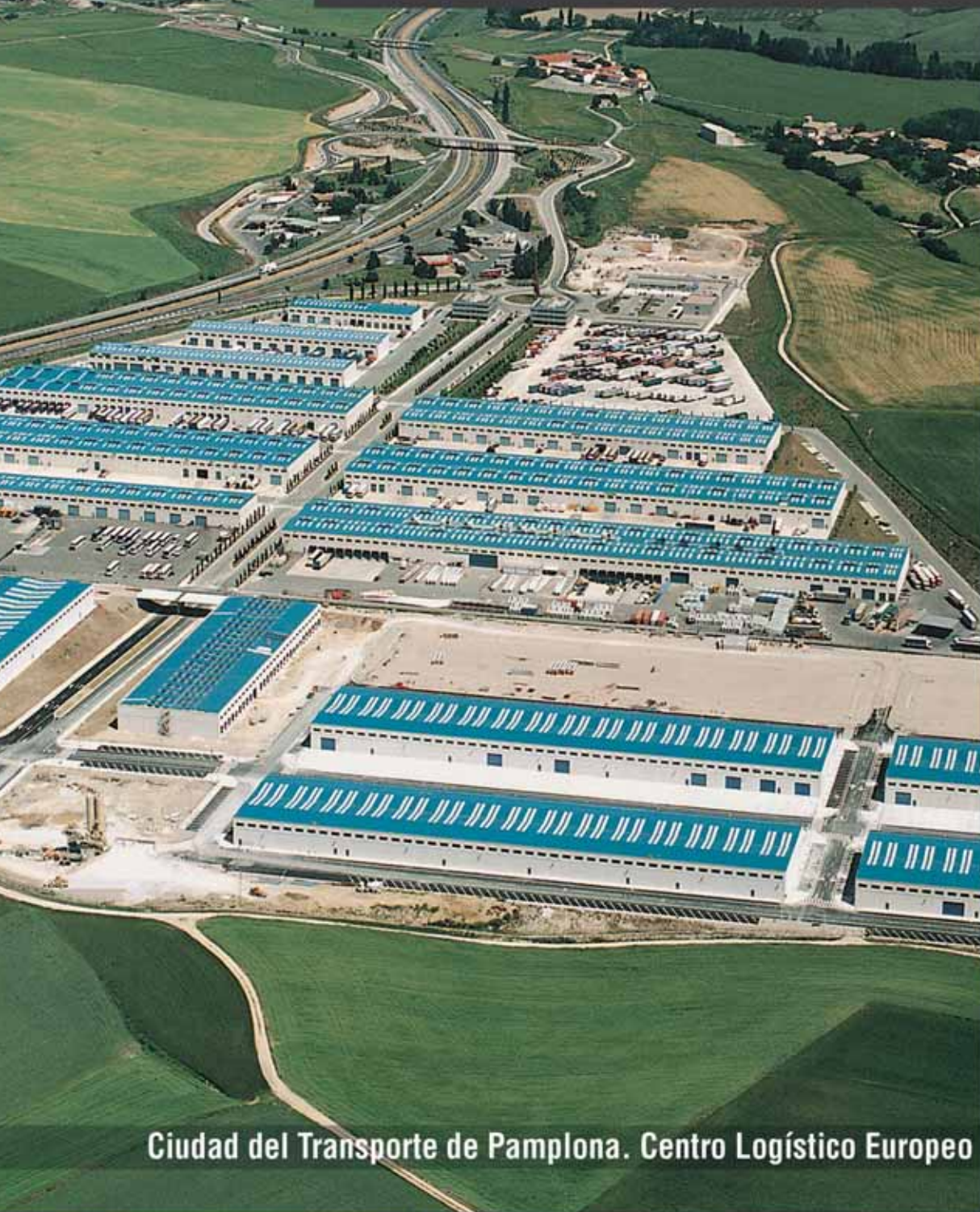
Ciudad del Transporte de Pamplona. Centro Logístico Europeo