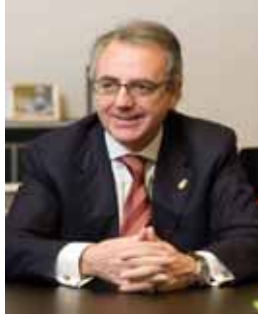
Miguel Sanz Sesma Presidente de la Comunidad Foral de Navarra