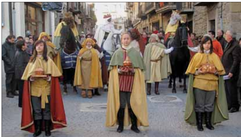
Id a Belén y si acaso veis al Niño...