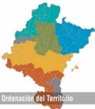
Mapa de Planes de Ordenación del Territorio