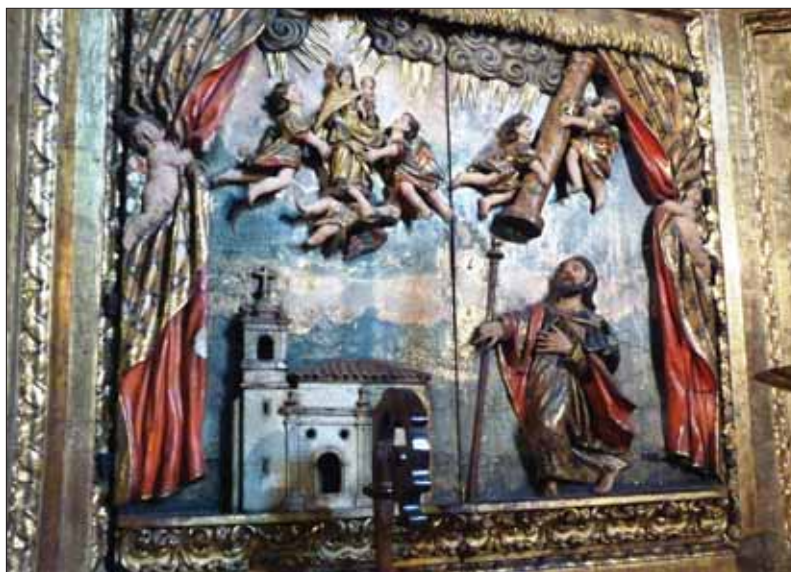
Aparición de la Virgen del Pilar a Santiago en la parroquia de Santiago de Puente la Reina.

La presencia de Santiago en las composiciones iconográficas relativas a la vida pública de Cristo es constante, aunque en ellas no se puede considerar su protagonismo iconográfico. Su presencia está patente, sin embargo en diversos momentos de su vida como: