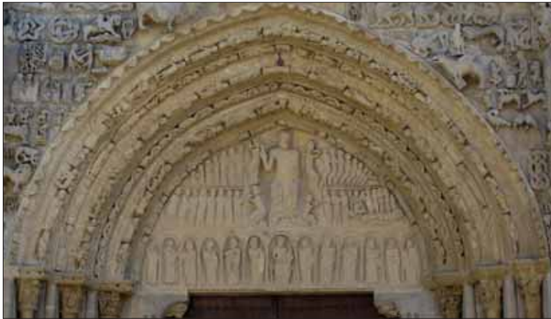
Portada de Santa María de Sangüesa, uno de los protagonistas del audiovisual realizado por el Gobierno de Navarra.