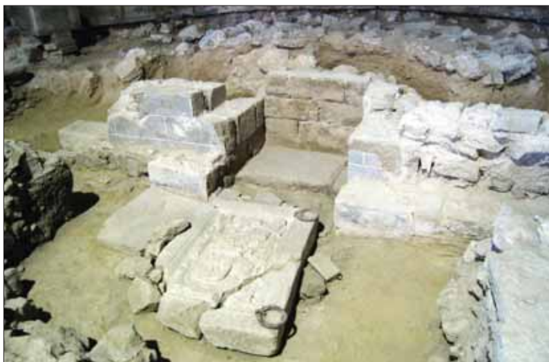
Excavaciones en San Pedro de la Rúa de Estella.

En Navarra, cultura y naturaleza se fusionan. Villas romanas, iglesias románicas, monasterios y catedrales góticas, torres y murallas medievales o cascos históricos, nos revelan