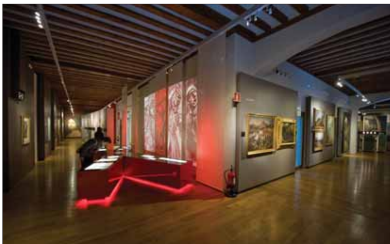
Museo Carlista de Estella.

exposiciones temporales, que profundizará en aspectos concretos del Carlismo o vinculados con él, relaciones, influencias, etc. Finalmente, el sótano contiene una exposición gráfica sobre la historia y rehabilitación del edificio.