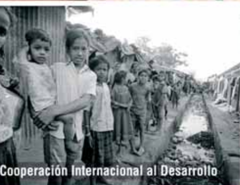
Cooperación Internacional al Desarrollo

XXV ANIVERSARI AMEJORAMIENT DEL FUER 1982-2007