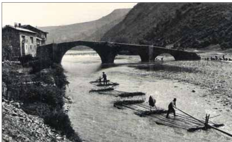
Almadías en Burgui.

Las celebraciones podrán emplear este título en sus actividades de promoción y su