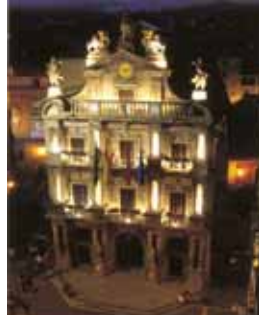
Portada: Fachada del Ayuntamiento de Pamplona