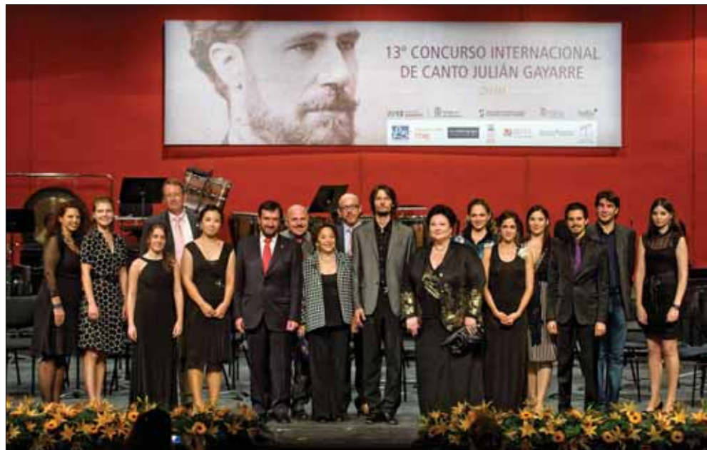
Los participantes del Concurso en la gala de entrega de premios.