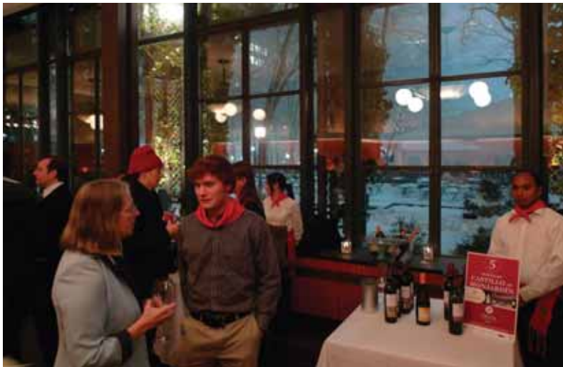
"Semana de Navarra en USA" celebrada en el Bryant Park de Nueva York.