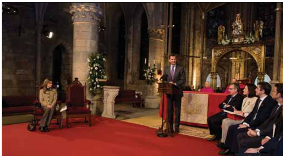
Intervención del Príncipe Don Felipe en la apertura del Año Jacobeo 2010.