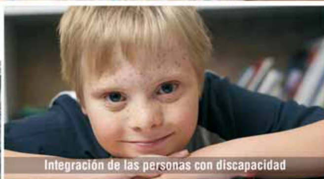
Integración de las personas con discapacidad