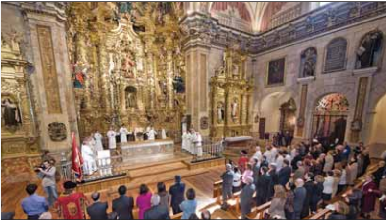
Iglesia de San Miguel de Corella. Jornada de reapertura.