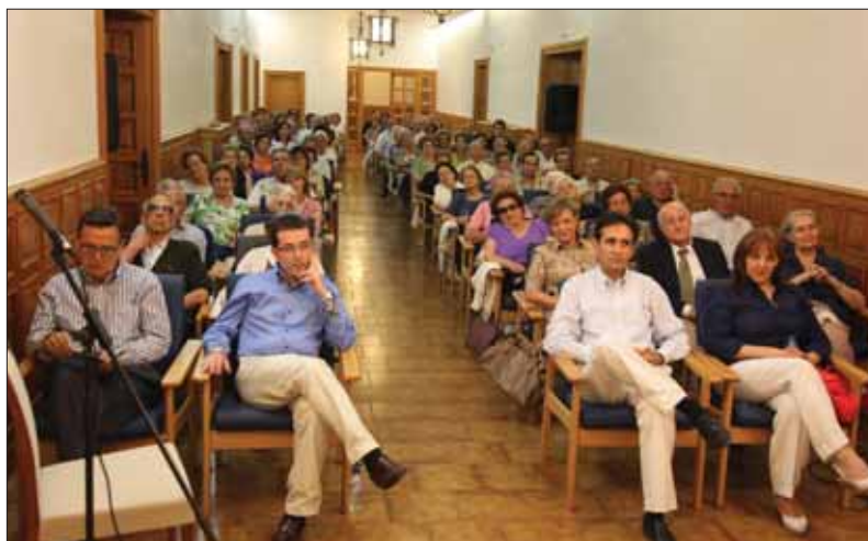
Conferencia del 6 de agosto.

La conferencia estuvo a cargo del Excm o y Rvm o Sr. don Antonio Cañizares, cardinal prefecto del Culto Divino y Disciplina de los Sacramentos de Roma, que fue presentado