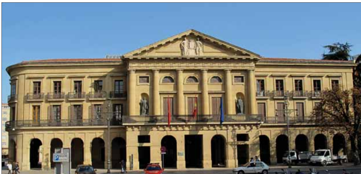
Palacio de Navarra.

que es un sistema de riesgo unilateral para Navarra, de forma que cualquier error en el ejercicio de su autonomía tributaria no puede ser corregido mediante el recurso a la financiación estatal.