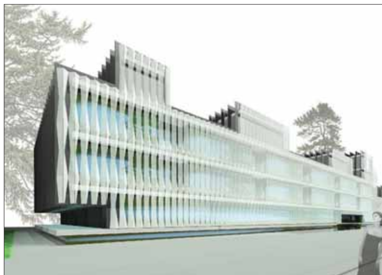
El futuro Centro de Investigación Biomédica.

B) La generalización de un Plan de Mejora de Calidad en Atención Primaria, basado en el éxito del pilotaje de un nuevo modelo de