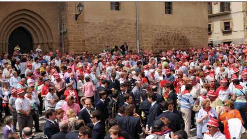
Salida de misa.

esperaba en el que tras los cantos de las auroras se nos ofreció una reconfortante chocolatada para repornernos del viaje, a la par asistimos expectantes al singular bandeo de campanas... la misa presidida por la Virgen de Jerusalén y cantada por la "Coral de Carlos" con esas canciones que todos pudimos cantar y que ya nos hicieron sentir que se nos presentaba un día muy especial, en el que estuvimos acompañados por todos los artajoneses, con su alcalde y corporación municipal a la cabeza, compartieron también la jornada con nosotros entre otras autoridades, el Consejero de Relaciones Institucionales y Portavoz y Consejero de Educación, Alberto Catalán y la Directora General de Relaciones Institucionales, Lola Eguren, del Gobierno de Navarra; la Presidenta Elena Torres y el Secretario Se-