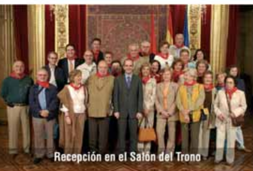
Recepción en el Salón del Trono