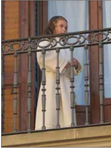
Volved, sin entrar nuevamente en Jerusalén,...

Finalmente y desde 1994 la Adoración de Magos y pastores, se trasladó a su emplazamiento actual en la Abadía.