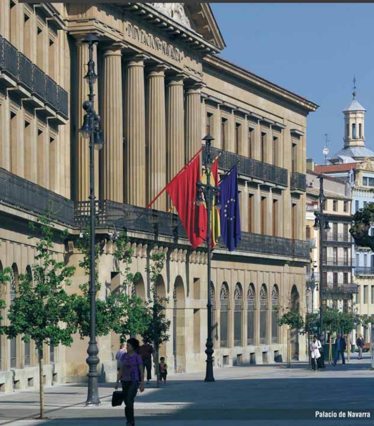
Palacio de Navarra