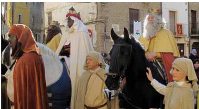
... ¿y en esa pobre morada?...

La primera foto, conservada de 1919, muestra a los Reyes cubiertos con los capotes de toreo que el Ayuntamiento guardaba, los pastores con espalderos y las pastoras con falda roja, delantal negro, blusa con puntillas y chaleco de terciopelo. Todo ello ha ido cambiando con el paso de tiempo como puede verse por