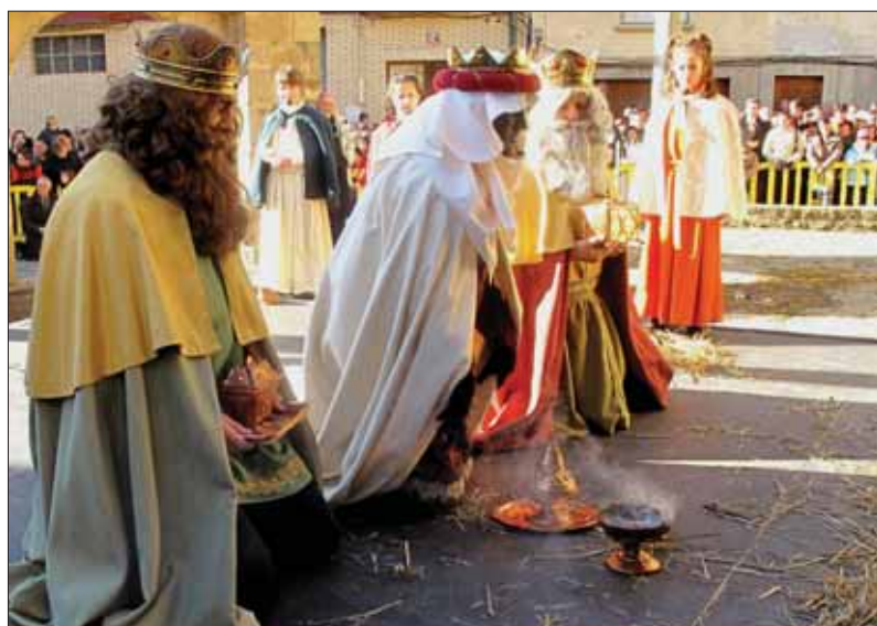
... y ante Ti quemo el incienso...

El cambio en la celebración de la misa posterior al Misterio, habitual en San Salvador, a la parroquia de Santiago, en 1976, motivó una desviación desde el Palacio de Herodes hasta la Placeta de esta parroquia. El rincón de la panadería de Caballero fue el lugar de la Adoración de los Magos y el aviso del Ángel se hacía desde su balcón. Al año siguiente se retrasó el comienzo a las nueve horas.