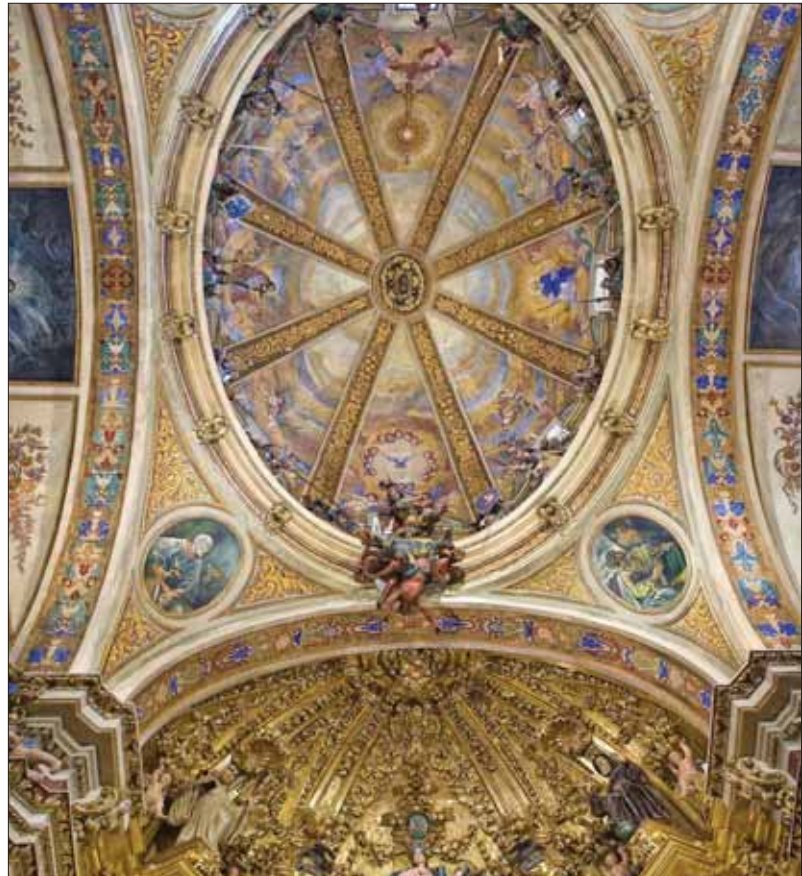
Cúpula de la iglesia de San Miguel de Corella.

La cubierta lateral sur, en mal estado y con la estructura con zonas con pudrición y xilófagos, tenía su punto más débil en la zona que limita con la torre donde se había producido la rotura de un cabio. En esta zona había graves problemas estructurales de la fábrica que provocaron el hundimiento parcial de una bóveda. La cubierta lateral norte era la zona peor conservada del edificio, con tramos muy deteriorados y hundimientos del entrevigado sobre las bóvedas.