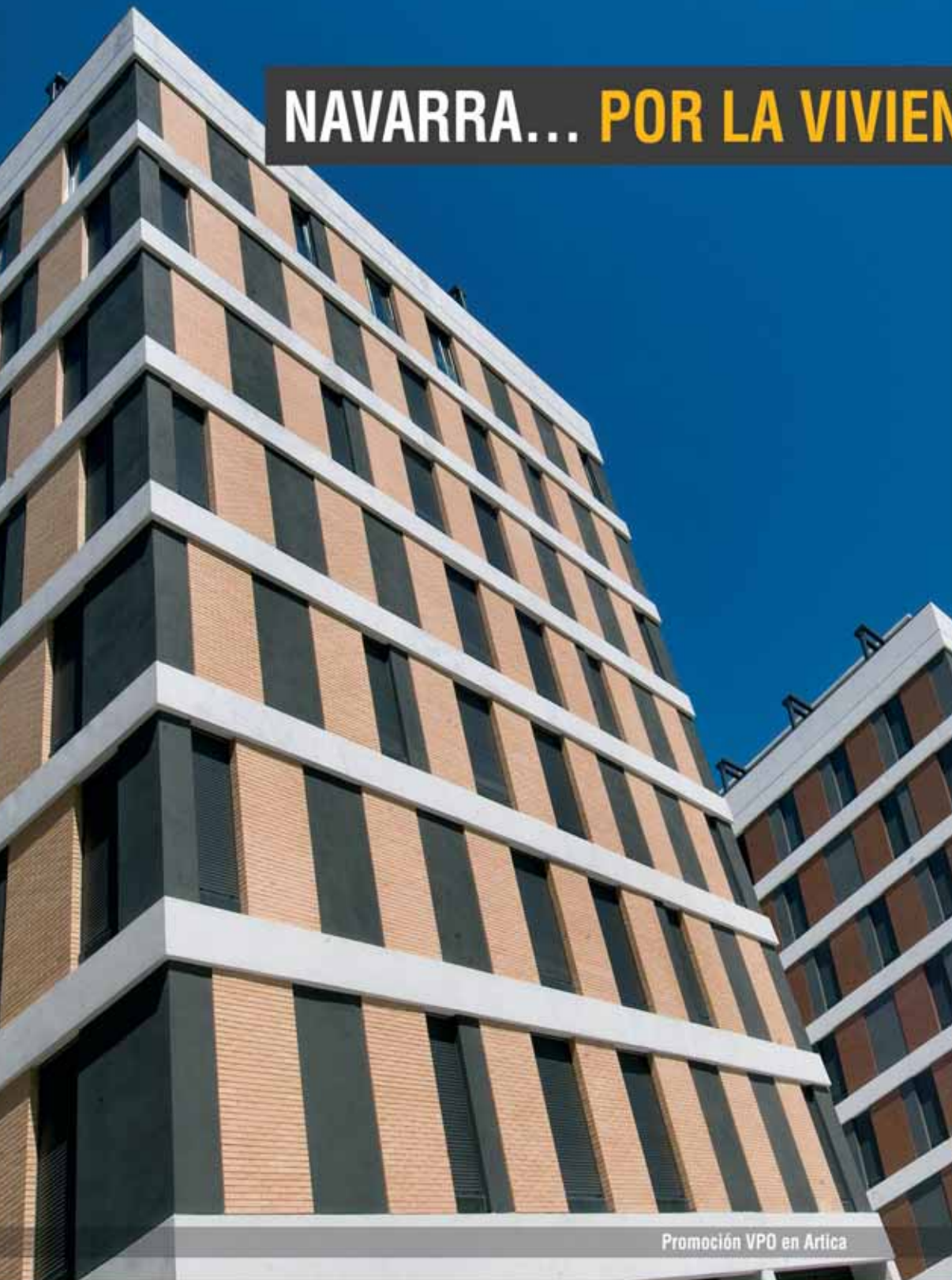
Promoción VPO en Artica