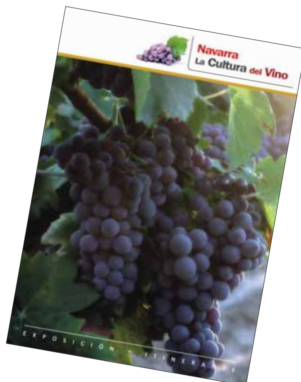
Folleto de la exposición “Navarra. La Cultura del Vino”.