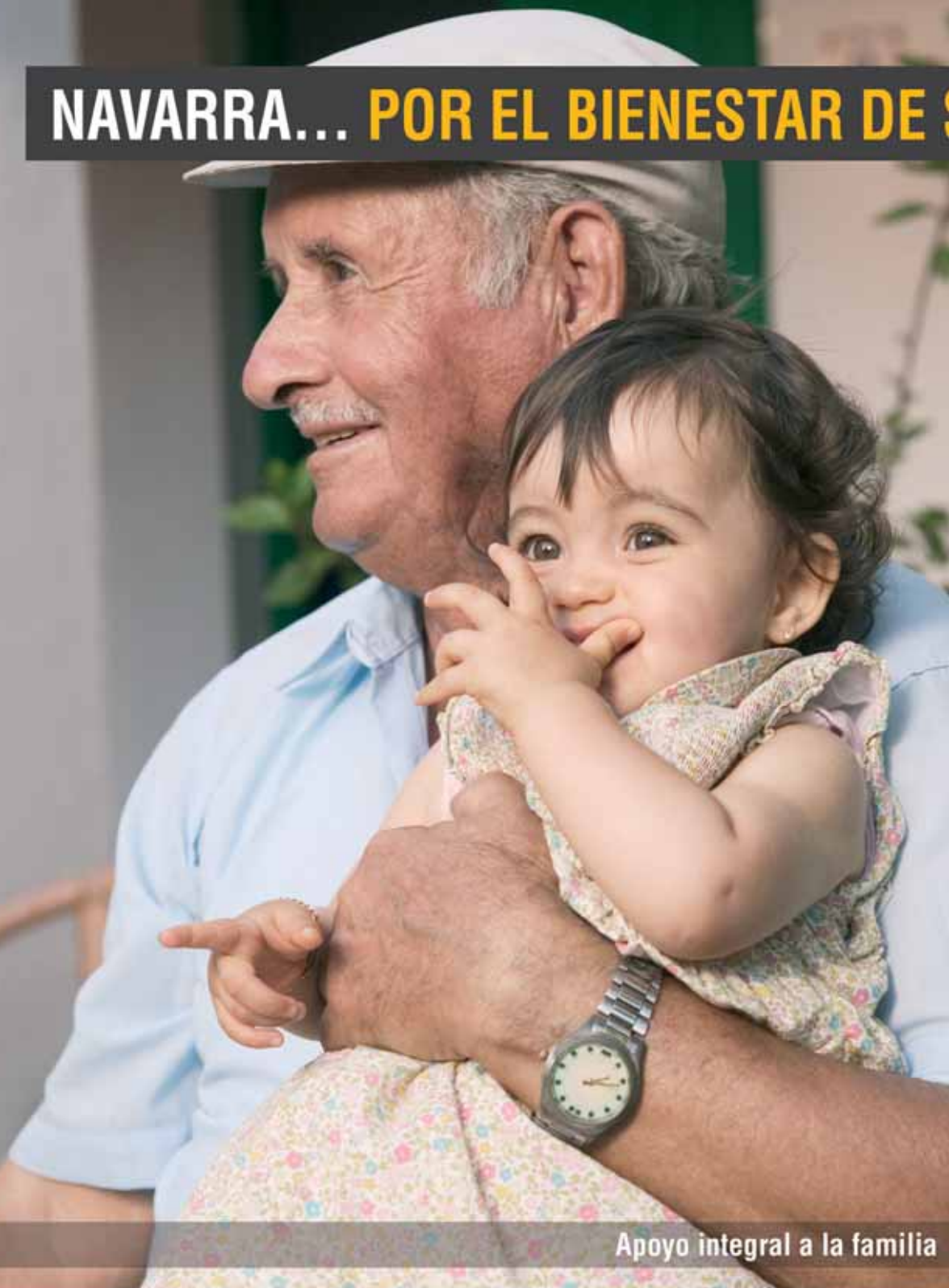
Apoyo integral a la familia

XXV ANIVERSARI AMEJORAMIENT DEL FUER 1982-2007