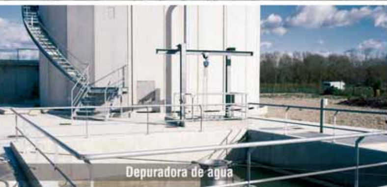
Depuradora de agua