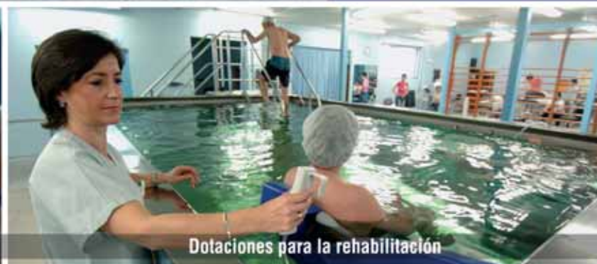
Dotaciones para la rehabilitación