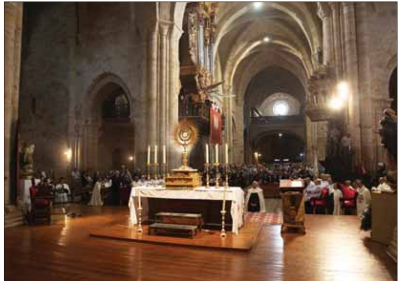
Comienzo de la ceremonia.

Con la antigua iglesia monacal rebotante de fieles y con una especial solemnidad, la villa de Fitero celebró el Te Deum anunciado, presidido por el señor arzobispo don Francisco Pérez, asistido por el párroco de Fitero y el postulador de la Causa, el navarro y carmelita descalzo P. Ildefonso Moriones. Varias decenas de sacerdotes se sumaron al acto, entre ellos los deanes de las catedrales de