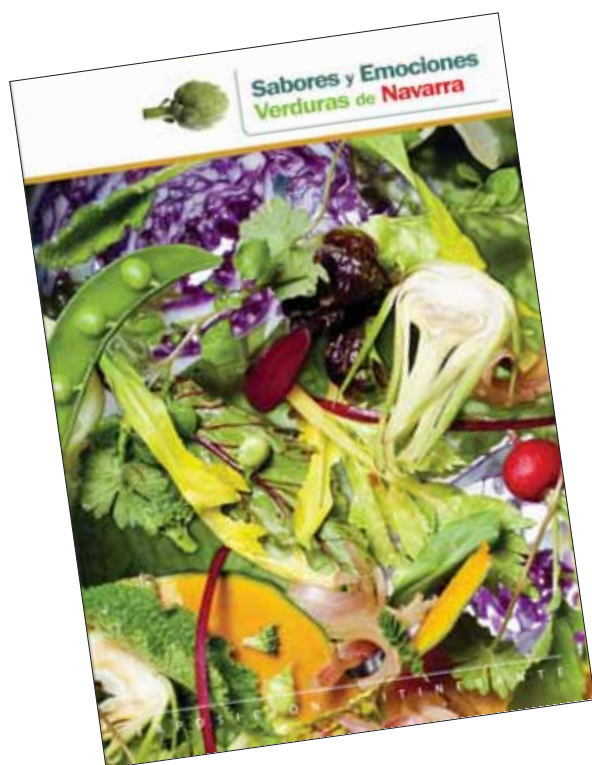
Folleto de la exposición “Sabores y Emociones. Verduras de Navarra”.

Este libro, al igual que “Navarra. La Cultura del Vino”, distinguido por Gourmand World Cookbook Awards como el mejor libro español sobre el vino, puede adquirirse en el Fondo de Publicaciones del Gobierno de Navarra (Navas de Tolosa 21, Pamplona) y a través del portal web: www.cfnavarra.es/publicaciones