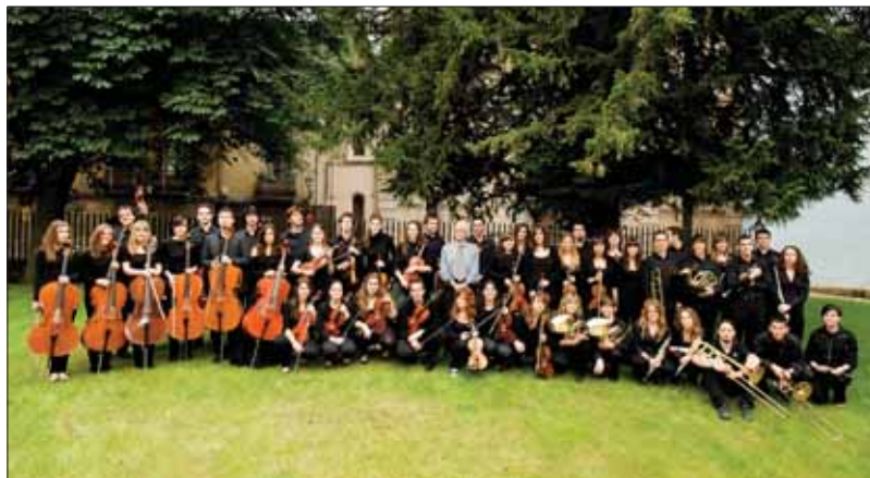
Orquesta Sinfónica del Conservatorio Profesional "Pablo Sarasate".

en las localidades de Szafarnia, Brodnica, Torun y Bydgoszcz. La orquesta, formada por 50 alumnos y cinco profesores, ha interpretado obras de Falla,