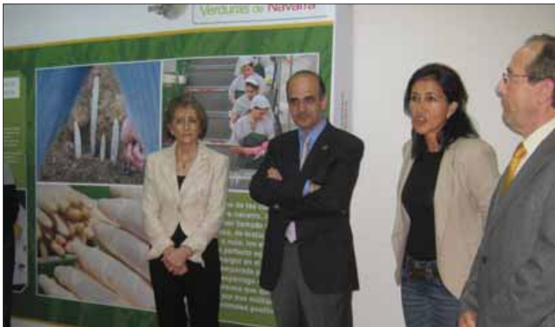
Inauguración de la exposición "Sabores y Emociones. Verduras de Navarra". De izda. a dcha. Presidenta de la Casa de Navarra, Consejero de Relaciones Institucionales del Gobierno de Navarra, Concejala de Acción Social y Juventud del Ayuntamiento de Zaragoza y Presidente de la Federación de Casas Regionales en Zaragoza.