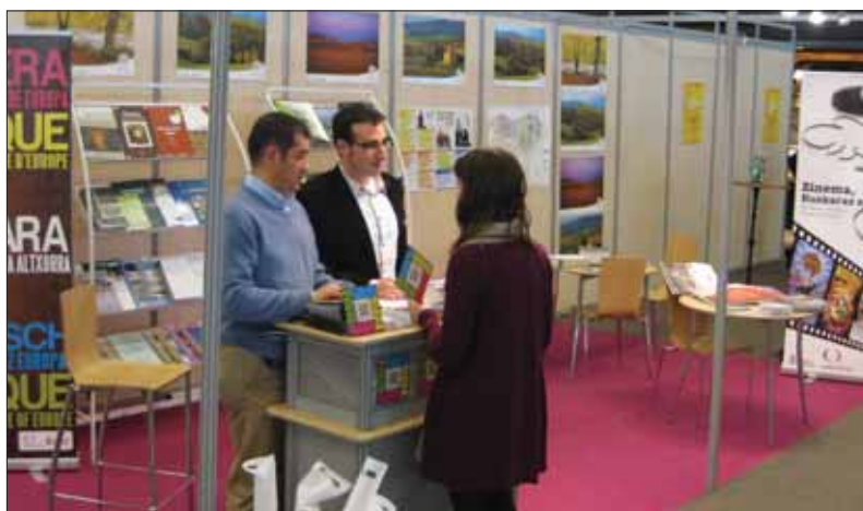
Stand de la Feria de Expolangues.