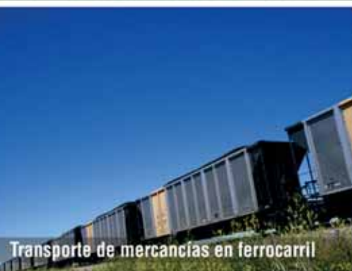
Transporte de mercancías en ferrocarril