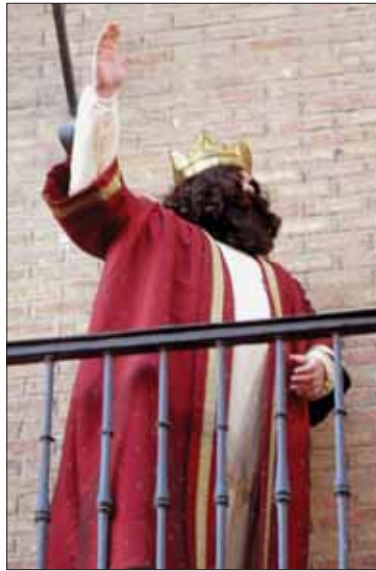
Saludo de Herodes a los Magos.