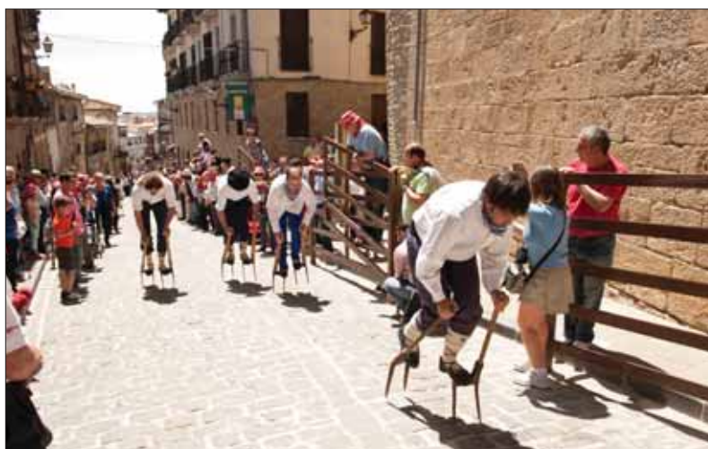
Carrera de layas.

Durante el camino fuimos repasando el gran día que habíamos vivido, como queriendo grabarlo bien fuerte para que nada se borrara y quedara para siempre en nuestros corazones a la vez que nos brotaba desde lo más profundo un fuerte, emocionado y sincero ¡¡ Viva Artajona. Gracias Artajona!!