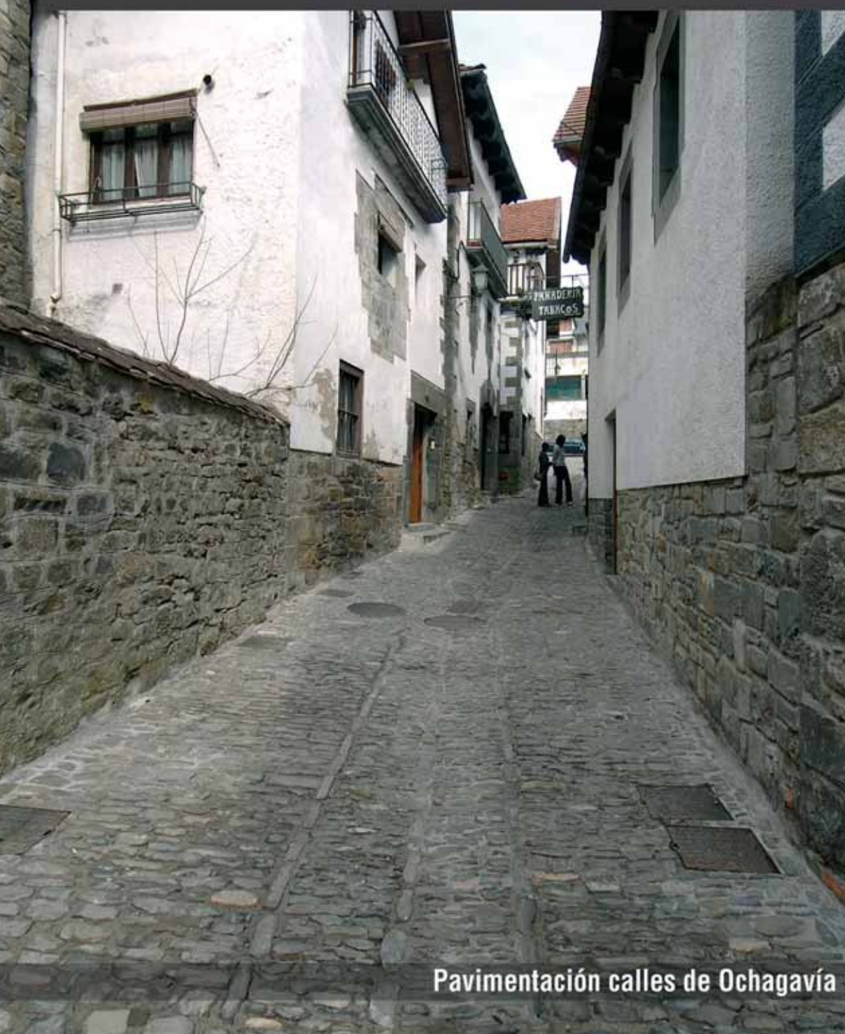
Pavimentación calles de Ochagavía