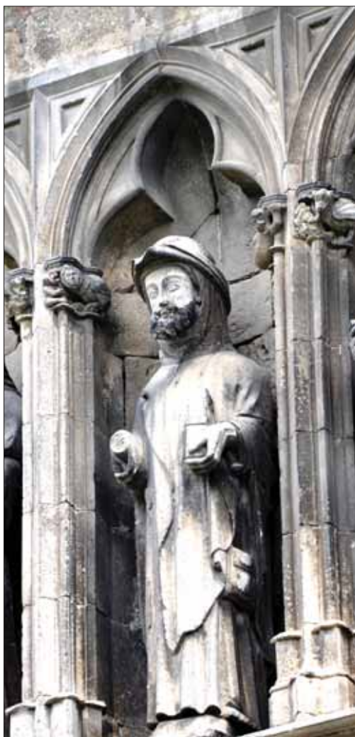
Santiago Apóstol en la portada de la iglesia del Santo Sepulcro de Estella.

No se trata en estas líneas de recordar la ruta jacobea a lo largo de Navarra, sino más bien recordar su presencia en este territorio pues hacer referencia a las peregrinaciones a Santiago de Compostela, supone evocar uno de los acontecimientos que más influencia ha tenido en la configura-