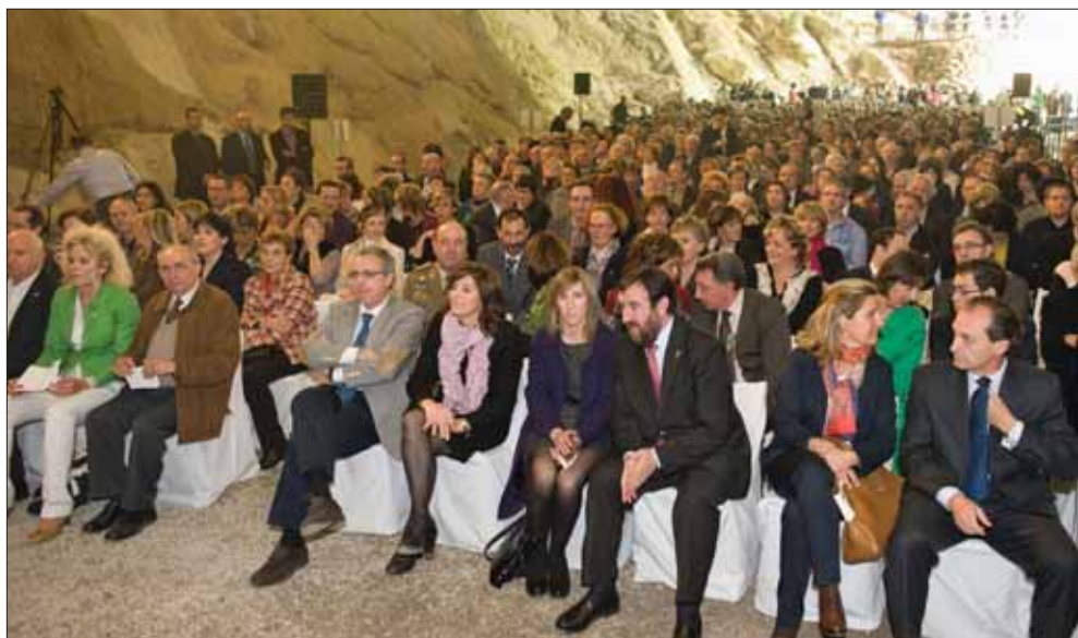
Asistentes a la entrega de los Premios de Turismo 2010 en las cuevas de Zugarramurdi.