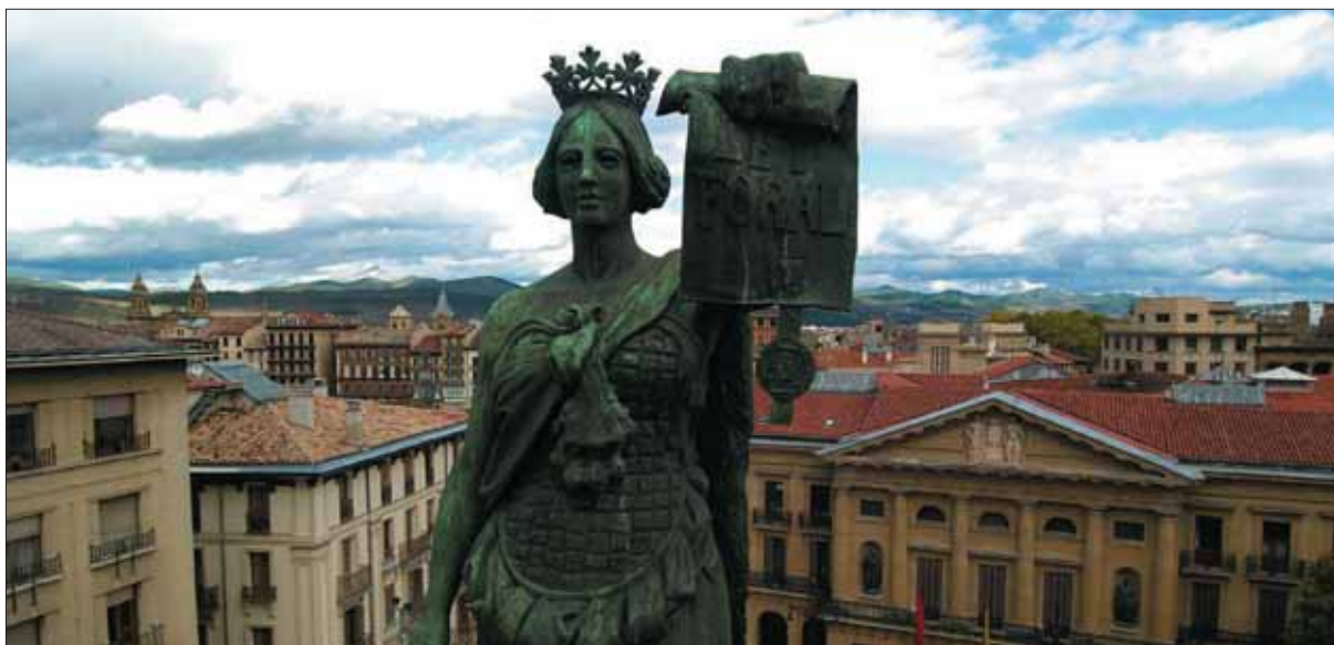
Imagen del Monumento a Los Fueros. Al fondo el Palacio de Navarra, sede del Gobierno de Navarra.

Comunidad con mayor renta per capita que la media estatal facilita una mayor recaudación con una teórica menor presión fiscal (algo por otra imposible según el vigente Convenio).