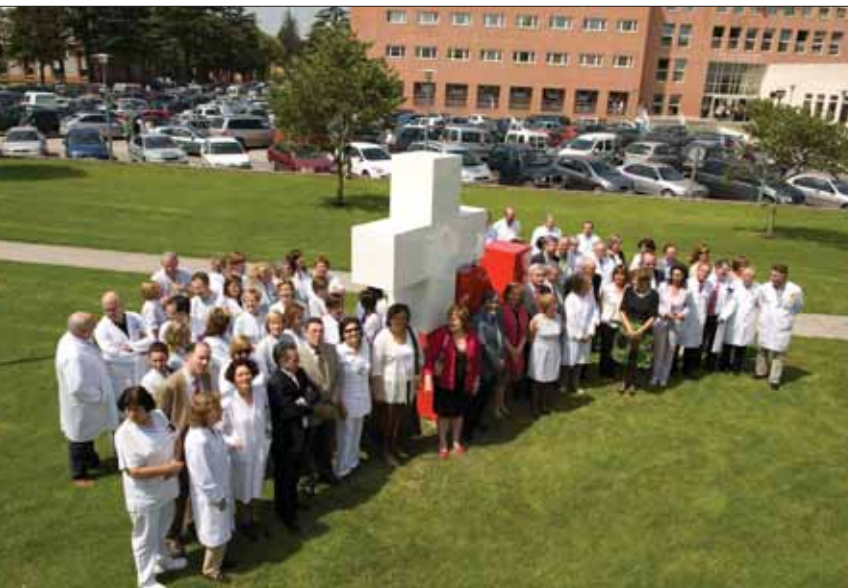
Presentación del nuevo logotipo de los centros hospitalarios.

En el primer trimestre del año, se experimentó un incremento de actividad del 2% respecto al mismo periodo del año pasado, realizándose 207.402 primeras consultas. A fecha 1 de julio de 2010, la espera para una primera consulta era de 15 días, con un descenso del 28 por ciento respecto al comienzo del año 2010. En los últimos siete meses, se han realizado 22.119 intervenciones quirúrgicas programadas, con espera reducida de 56 días en enero, a 46 días en junio.