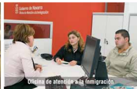
Oficina de atención a la inmigración