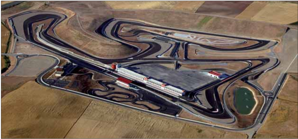
Circuito de Navarra.

Ubicado en la localidad navarra de Los Arcos, a tan sólo 58 kilómetros por autovía de su capital Pamplona, el Circuito de Navarra se asienta un enclave estratégico dado el potencial económico de Navarra, el turismo de la región y, sobre todo, por los más de 290 días secos al año que disfruta la zona. Todas estas ventajas sumadas a la calidad y cantidad de pistas e instalaciones del complejo, hacen del Circuito de Navarra un referente del motor en el norte de España y sur de Francia.