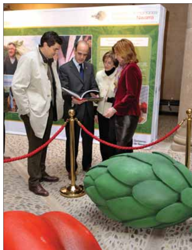
Presentación de las exposiciones en Tudela.

Las exposiciones ofrecen objetos tridimensionales, tres corpóreos grandes de verduras (espárrago, alcachofa y pimiento) y un racimo de uva.