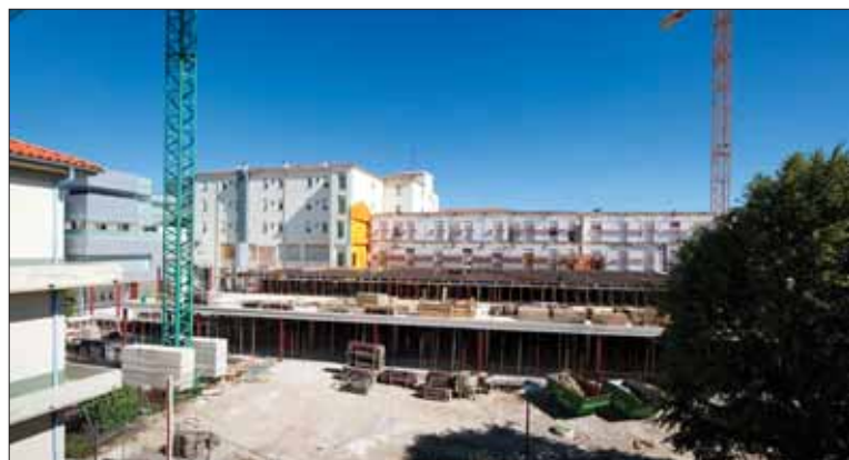
Obras en el Pabellón C.

3 - Edificio de Urgencias Su fin se prevé en noviembre de 2011, posteriormente se equipará el centro antes de su puesta en marcha definitiva.