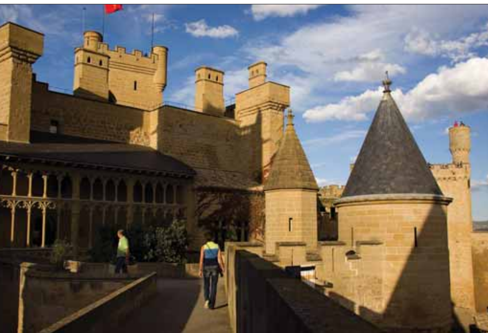
Castillo de Olite.