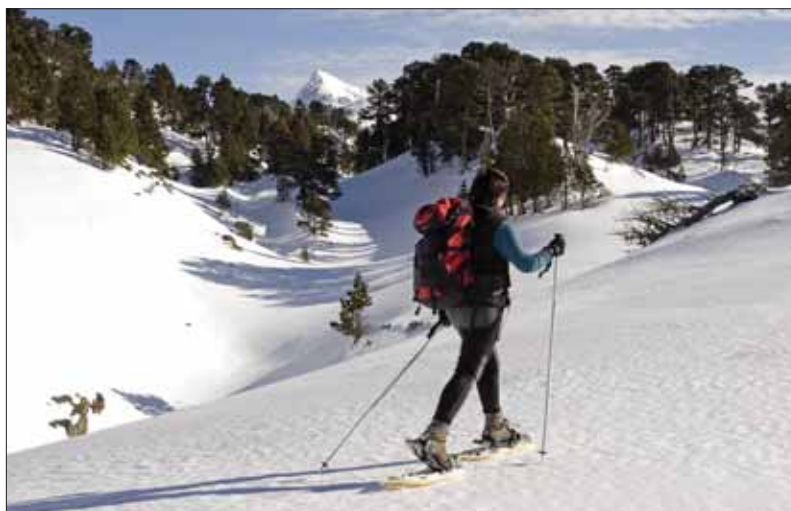
Nieve en Belagua.

Se alternan tradiciones religiosas y paganas. Sangüesa celebra la Epifanía en sus calles con la representación popular del Misterio de los Reyes Magos, uno de los cinco autos sacramentales que se conservan en España. Llegan los carnavales: en Lantz, el ri-