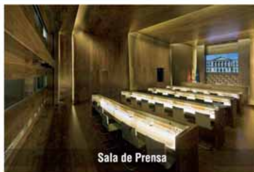
Sala de Prensa