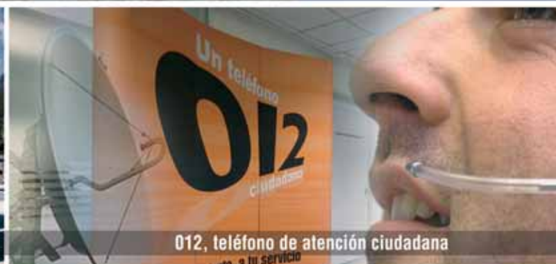
012, teléfono de atención ciudadana