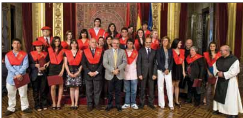
Acto de clausura del XIII Curso Internacional Navarra.

El curso, que en esta edición se ha celebrado bajo el título