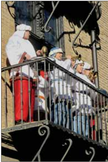
¿Dónde está el Rey que ha nacido?

versos con la entrega de los obsequios al Niño Jesús.