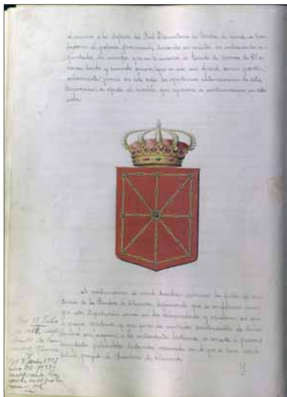
Acuerdo del escudo de Navarra de 1910.

En la misma sesión de enero en la que se aprobó el escudo oficial, se advirtió sobre la ausencia de una Bandera de Navarra, por lo que la Diputación decidió confeccionar una oficial para solemnidades. Así, el 15 de julio del mismo año, 1910, se aprobó la bandera de Navarra, que contenía un escudo conforme con el modelo recién aprobado. Esta primera bandera oficial fue izada en el Palacio de Navarra al día siguiente, 16 de julio, aniversario de la batalla de las Navas de Tolosa, que tuvo