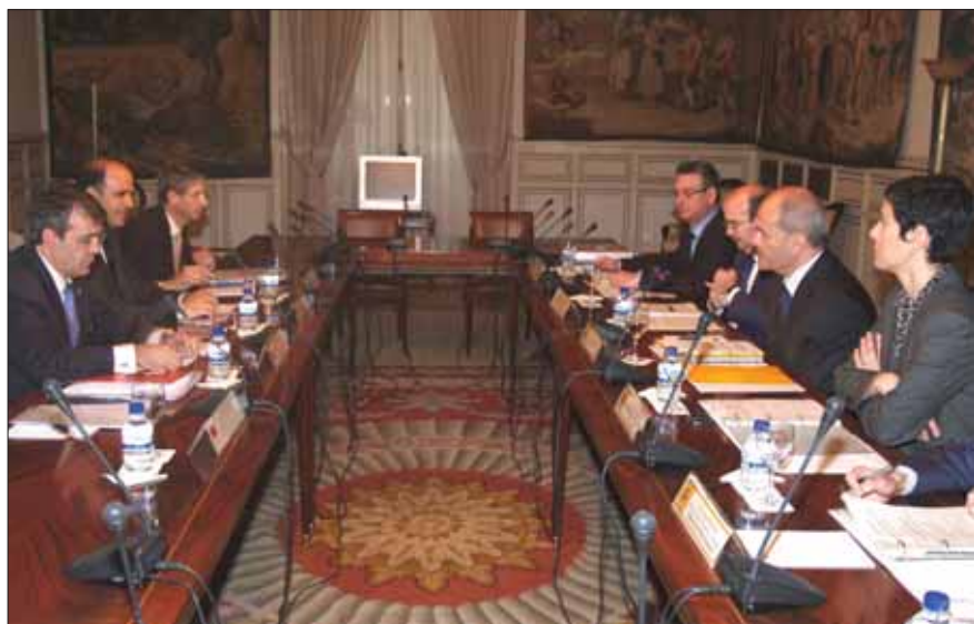
Sesión de trabajo de la Comisión Negociadora del acuerdo de reforma de la Lorafna.

La reforma suprime figuras jurídicas ya inexistentes o terminologías obsoletas y hace mención expresa tanto al Defensor del Pueblo de Navarra como al Consejo de