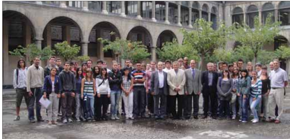
Cerca de un centenar de alumnos de FP realizaron prácticas en empresas europeas.

En el marco del Cuarto Plan de Empleo de Navarra (2009 - 2012), el Servicio Navarro de Empleo firmó un convenio con la Fundación Adecco para conseguir la integración laboral de los colectivos más desfavorecidos. Para ello se elaborarán planes de acceso al empleo con itinerarios individualizados, autorización y acompañamiento en todas las fases del proceso. La firma de este convenio,