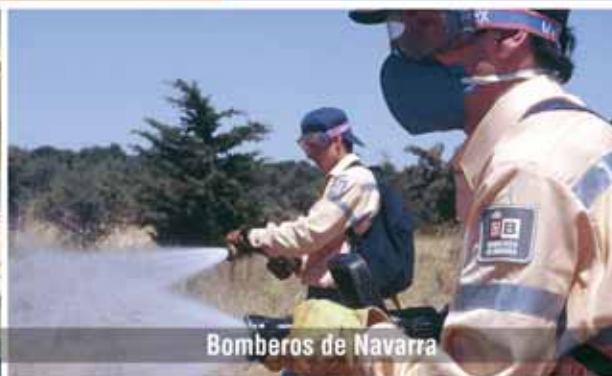
Bomberos de Navarra