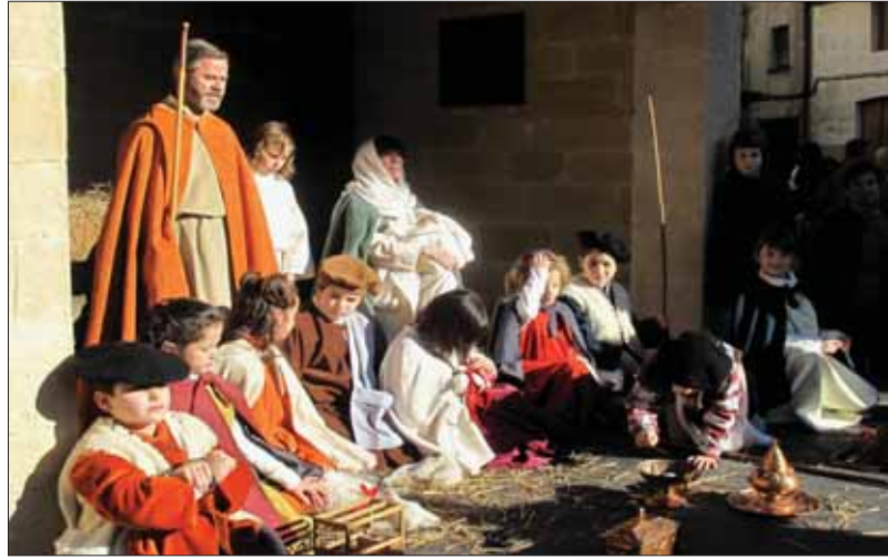
San José y María con el Niño posan con los pastorcillos al final de la representación.

Pero siempre ha merecido la pena porque el Misterio encierra en su forma y en el fondo el resumen que da sentido a todo lo que significa la Navidad cristiana, tan bien representada en las piezas artísticas de nuestra ciudad y que resumo en el cuadro siguiente.