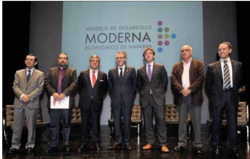
El Presidente Sanz, en el centro, acompañado de representantes de organizaciones empresariales, sindicatos y universidades, en el acto de puesta en marcha del plan Moderna.

El Plan Moderna es la “Ley de Economía Sostenible” de Navarra, y está impulsado por el Gobierno de Navarra (UPN), el Partido Socialista de Navarra (PSN), la Confederación de Empresarios de Navarra (CEN), los sindicatos mayoritarios en Navarra, UGT y CCOO, y las dos universidades navarras, Universidad Pública de Navarra (UPNA), y Universidad de Navarra (UN) y fue aprobado por el Parlamento de Navarra con el apoyo del 76% del arco parlamentario: todos los partidos (UPN, PSN, CDN e IU) votaron a favor, excepto NaBai. “Con su aprobación, Navarra se convierte en la primera Comunidad Autónoma que afronta la salida de la crisis con un nuevo Modelo de Desarrollo Económico ya aprobado”, indica el Vicepresidente Segundo y