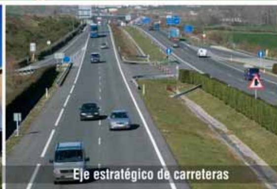
Eje estratégico de carreteras