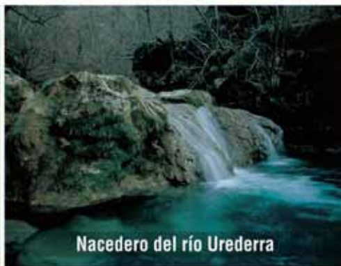
Nacedero del río Urederra