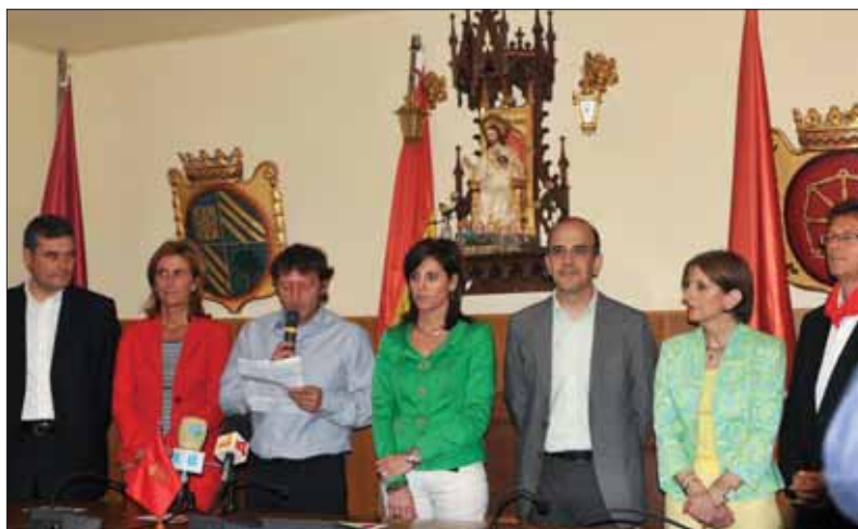
Recepción de autoridades.

Este año, se pensó en la villa de Artajona, su recién restaurado Cerco y su magnífico conjunto fortificado medieval tenían suficiente atractivo para convocarnos. La