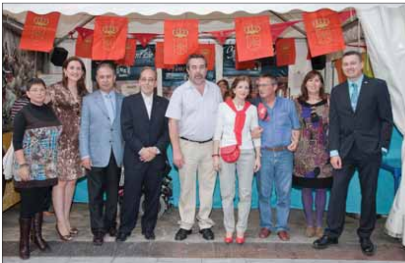
El Alcalde de Zaragoza, Vicealcalde y otros miembros de la corporación municipal visitan el stand de la Casa de Navarra en las fiestas del Pilar.

tante por estar al día en todo cuanto acontece en Navarra, para transmitirlo a nuestros visitantes y animarles y facilitarles sus desplazamientos a Navarra; ese esfuerzo por mantener siempre la sede abierta – incluso los festivos – porque entendemos que para dar a conocer Navarra la Casa debe estar siempre abierta y abierta a todos, para así poder mostrar mejor tanto la riqueza patrimonial de Navarra, como su presente y proyectos de futuro; ese trabajo para ser la mejor embajada cultural o escaparate de Navarra en la ciudad de Zaragoza, constituye nuestra actividad del día a día. Celebramos las fiestas de San Francisco Javier y de San Fermín, pero no nos quedamos ahí. Entendemos que Navarra es más que fiesta.