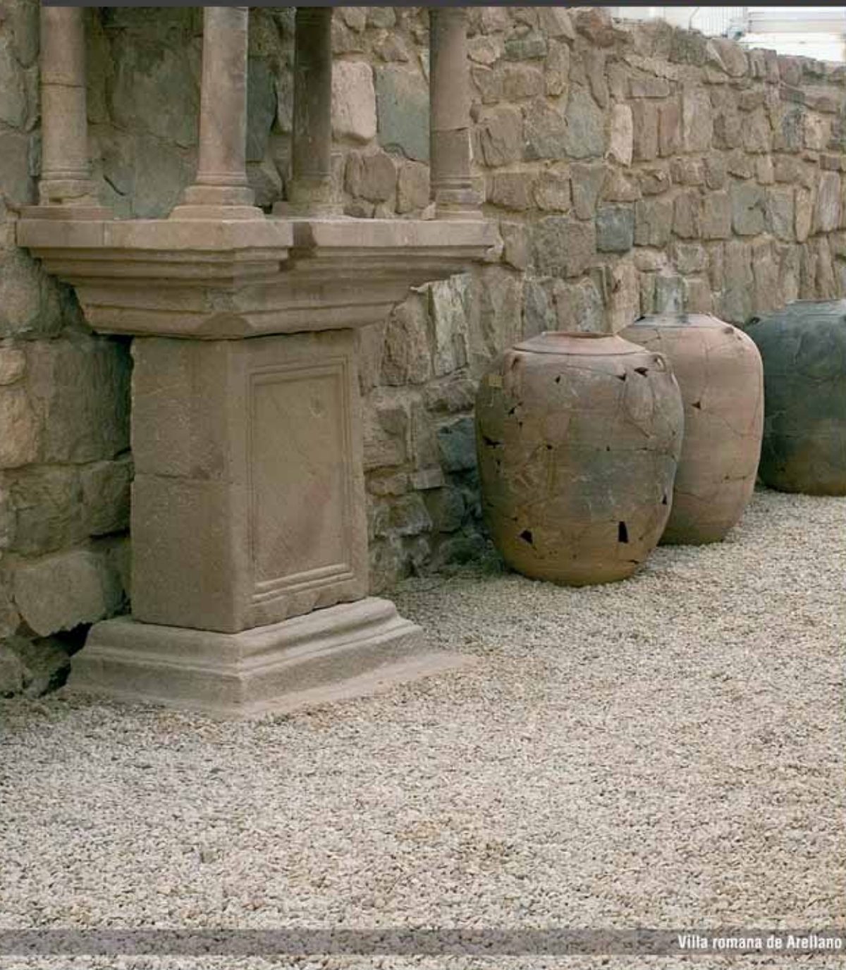
Villa romana de Arellano