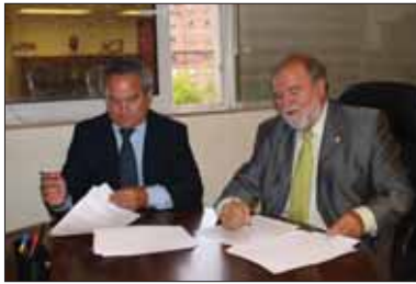
Convenio entre el Servicio Navarro de Empleo y la Fundación Adecco.

Un total de 93 alumnos de Formación Profesional de Navarra realizan prácticas formativas durante tres meses en empresas de distintos países europeos, Italia, Reino Unido y Portugal. Las estancias tienen como objetivos, bien la realización del módulo denominado “Formación en centros de trabajo”, que es obligatorio para obtener cualquier titulación de Formación Profesional, o bien llevar a cabo prácticas complementarias en unas condiciones sociolaborales y culturales distintas a las de su entorno habitual. De esta forma, estos futuros profesionales desarrollan y perfeccionan sus conocimientos técnicos y lingüísticos, mejoran sus aptitudes y competencias profesionales y, sobre todo, potencian sus posibilidades de inserción profesional, tanto en la Comunidad Foral como en los países de acogida.