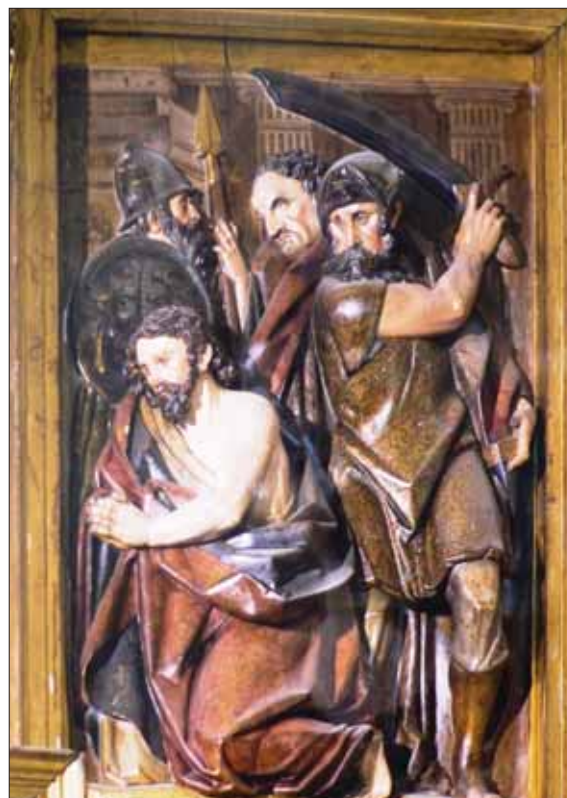
Martirio de Santiago en la parroquia de Santa María de Viana.

símbolo, ya como peregrino, serán las veneras. En principio es la insignia que muestra a todos que el peregrino ha estado en el santuario de Santiago, en cuyo atrio se vendía entre otros recuerdos (Aymerico Picaud en su descripción del templo, así lo cuenta: “detrás de la fuente está, según dijimos, el paraíso, pavimentado de piedra, en el que entre los emblemas de Santiago, se venden las conchas”). Estas veneras lo identifican por toda Europa, y el poder curativo de las mismas, es ampliamente divulgado desde finales del siglo XI.