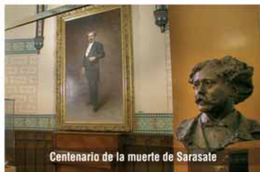
Centenario de la muerte de Sarasate