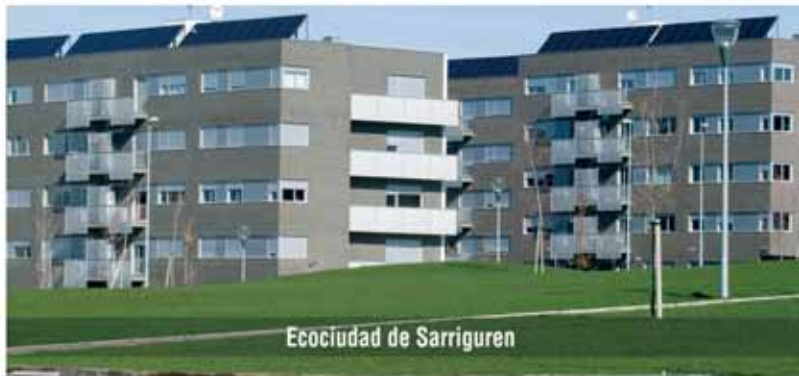
Ecociudad de Sarriguren