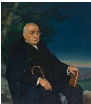
Arturo Campión (1951).

En París se mantuvo en contacto con las orientaciones francesas más moderadas en ese momento (impresionismo sobre todo), pero sin desligarse de Navarra, por lo que la producción de ese momento se repartió por igual entre paisajes impresionistas de la capital del Sena y el “tema navarro” (retratos, escenas de género, representaciones históricas, tradiciones en línea con la pintura etnográfica), de orientación estilística clásica española. Merecen destacarse sus vistas de calles (Montmartre, Nôtre Dame, Pescando en el Sena, Paisaje nocturno del Sena), todas pintadas sobre tablitas con factura abocetada, y perspectiva diluida en la distancia siendo notorio su interés por la luz diurna o nocturna, que en conjunto manifiestan una predilección por Monet, Renoir, Sisley o Caillebotte. También pintó retratos a la manera francesa (Nanet, Mlle. Ivan, estudios masculinos, y su conocido Autorretrato de 1912), así como desnudos (Combinación de la ruleta), muy manetianos. Entre los “temas navarros” figuran Paysans Basques o Mercado de Elizondo, Coronación del Primer Rey de