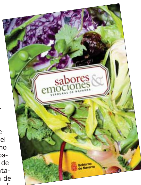
Portada del libro “Sabores y emociones. Verduras de Navarra”.

Más de 80 fotografías, 60 de ellas a doble página, ilustran cada una de las recetas cocinadas. Las instantáneas han sido realizadas por el fotógrafo navarro Patxi Úriz, cuya carrera profesional está marcada por dos premios de renombre internacional, como el galar-