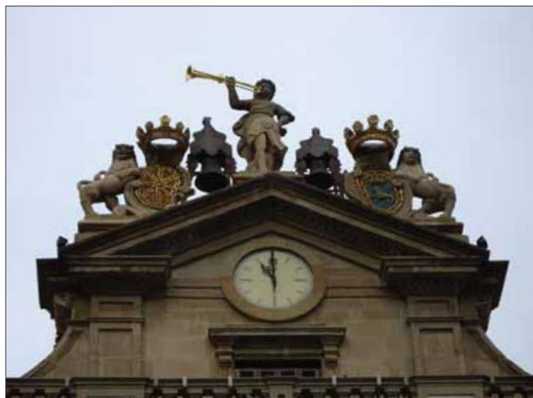
Ático de la fachada del Ayuntamiento de Pamplona.