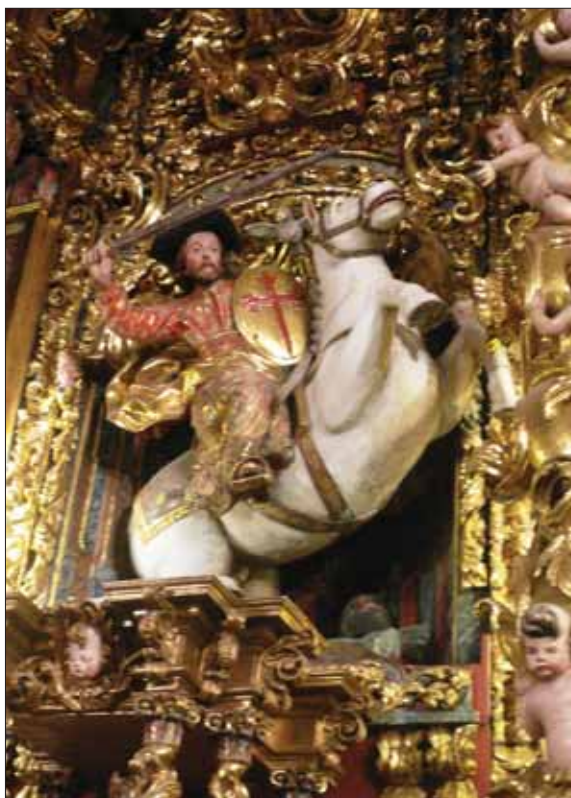
Santiago caballero en la parroquia de Santiago de Garde (Roncal).