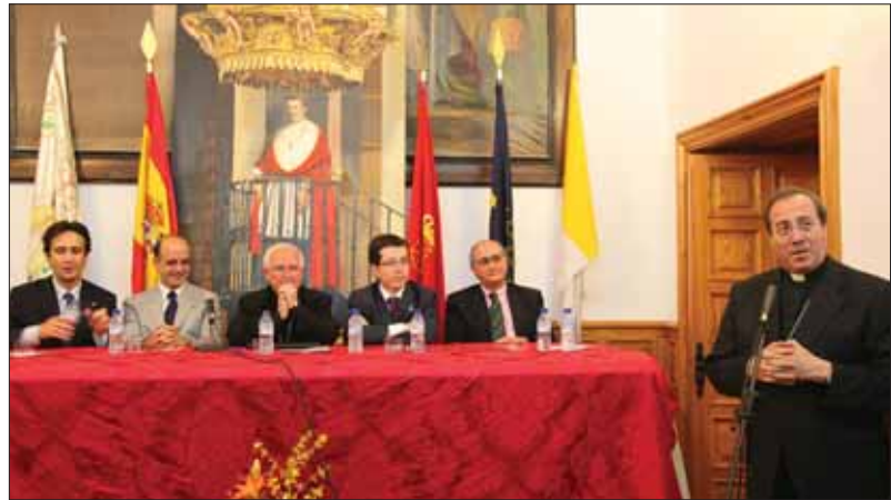
Reunión del 23 de julio.

Con distintos temas relacionados con su faceta espiritual, a su papel como promotor de las artes, o de compilador de las leyes de Indias, intervinieron distintos especialistas, algunos de ellos profesores de la citada Universidad que vienen trabajando sobre el personaje desde el año 2000, en que se celebró el