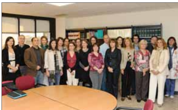
Reunión en Pamplona en torno al proyecto ShareBiotec.

Sarasate, Ravel, el Padre Donostia y Chopin durante su gira por Polonia, que se ha llevado a cabo entre los días 3 y 10 de septiembre.