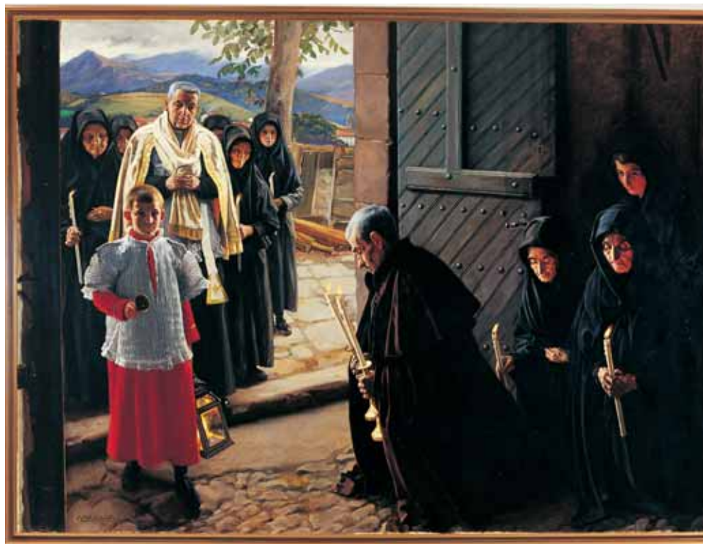
Un viático en la Montaña de Navarra, Baztán (1917).

En la evolución de su pintura se dan dos periodos separados por el año 1912, el de su llegada a París, donde su pintura se enriquece al contacto de las tendencias impresionista y postimpresionista.